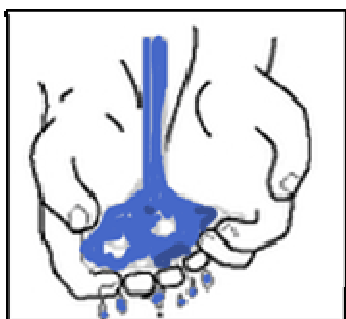
1. Mouillez les Mains